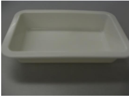
①平皿(角型 縦17cm 横10cm 深さ3.5 cm)